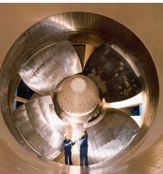
Bild 4: Simulationsbasierte Digitale Zwillinge sind am sinnvollsten dort einsetzbar, wo Komponenten variierenden, im Vorfeld unbekanntem Belastungen ausgesetzt sind.

Maßnahmen lassen sich frühzeitig initiieren. Für die Analyse können individuell definierte Zeiträume und Metriken betrachtet werden, um die ausgewählten Daten in grafischer oder tabellarischer Form darzustellen. So lassen sich spezielle Korrelationen verschiedener Daten selbstständig wählen.