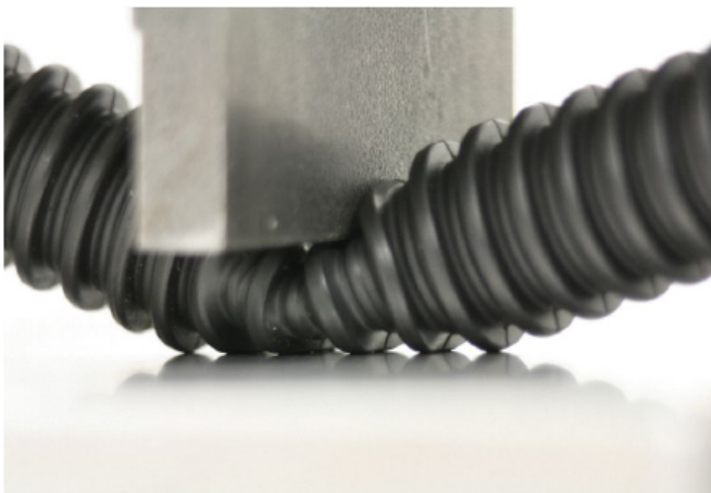
Durchführung eines typischen Druckversuchs