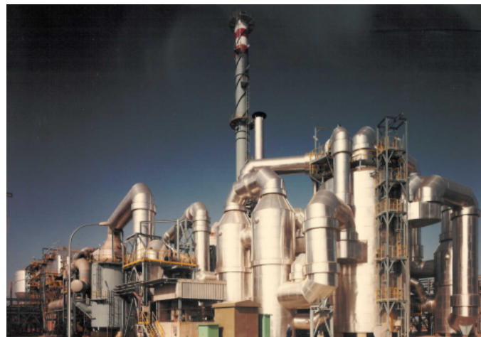
Abbildung einer Anlage zur Herstellung von Schwefelsäure.

Darüber hinaus wurde mit ergänzenden Schulungsmaßnahmen ermöglicht, dass diese Analysen zukünftig durch Outotec selbst durchgeführt werden können.